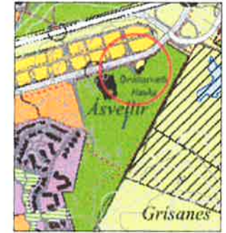
ADALSKIPULAG HAFNARFJARÐAR FYRIR SVÆÐIÐ

Á deiliskipulagsupprætti er sýndur byggingareltur sem er 50 x 75 metrar til þess að gefa svigrúm við endanlega hönnun og staðsetningu. Gólfkóti er 24.0 metrar og hámarkshæð á þaki í kóta 36.0 metrar.(h.y.s)